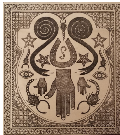
Talisman. Morocco, Africa. ca 1960. Gift of the Girard Foundation Collection, Museum of International Folk Art.