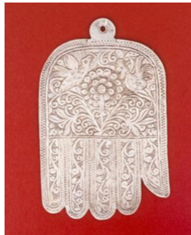
Amulet. Morocco, Africa. ca 1960. Gift of the Girard Foundation Collection, Museum of International Folk Art.

Las manos son símbolos de fuerza y poder. Alrededor del mundo las manos son vistas como un signo de bienvenida, protección y bendición. Las khamsas son amuletos o talismán de buena suerte, en forma de una mano. Se originaron en Marruecos y se extendieron entre las culturas mediterráneas. Khamsa es la palabra árabe para "cinco" y se refiere a los cinco dedos. Una khamsa con los dedos esparcidos es una mano que evade, mientras que una mano cerrada trae buena suerte.